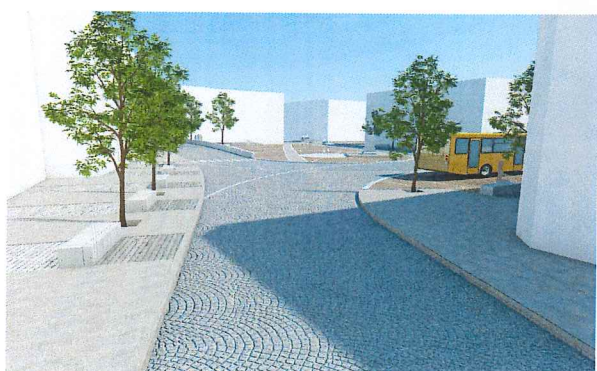
Vista Piazza III Novembre dall'accesso di via Rigoletto